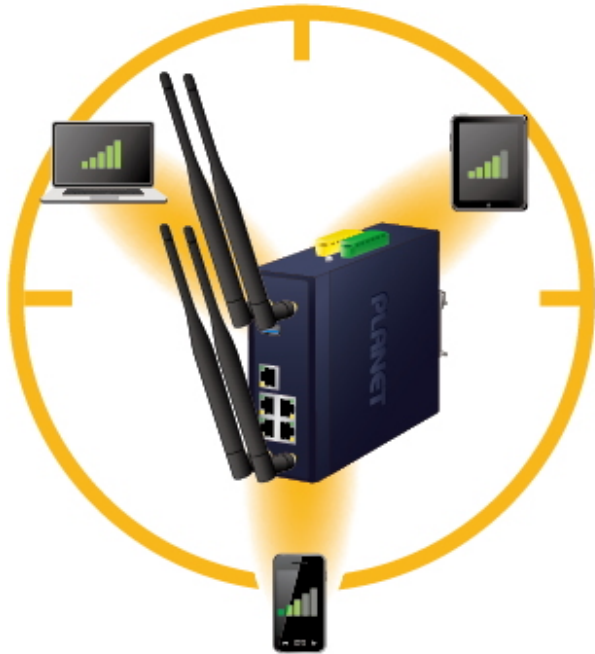
Dedicated and stable signals