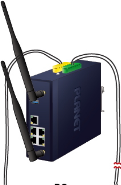
DC Power Failure