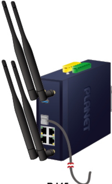
RJ45 Connection Link Down