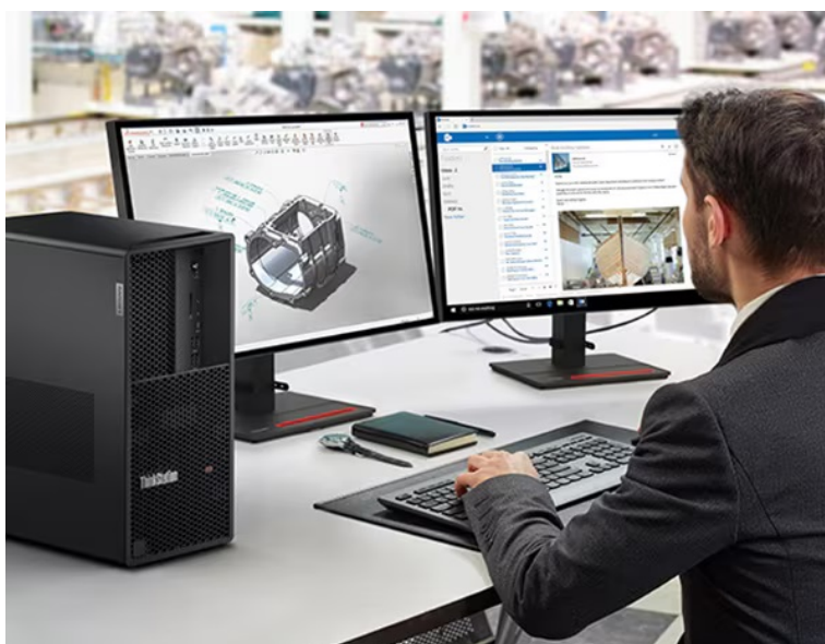
Lenovo ThinkStation P3 Tower